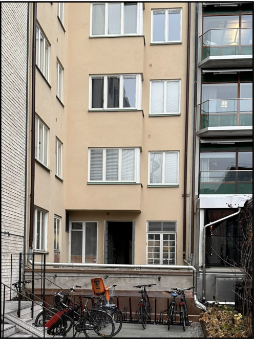
Bild från grannfastighetens gård

Nuläge / Bakgrund Befintlig otillgånglig gårdsyta med igensatt lanternin till garage. Lanterninen och tätskiktet till garaget skapar idag fuktproblemantik.