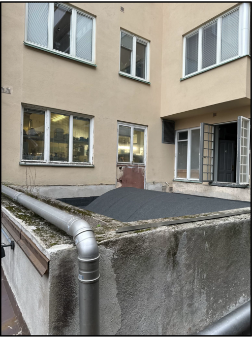
Bild befintlig fasad och gård med igensatt ovanljus

Genom tillbyggnad av ny paviljong skapas samtidigt ett nytt tätskikt för garaget.