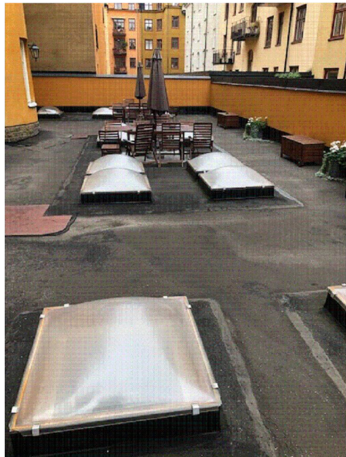
GÅRDEN MOT NORDOST (BILD 1)