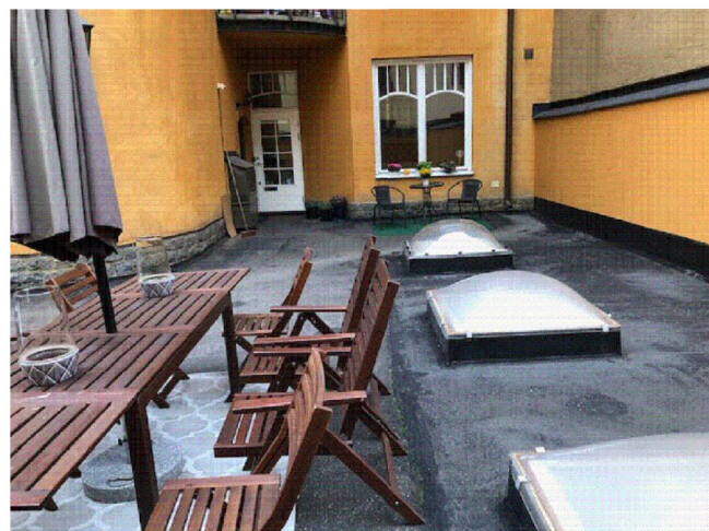
MOT NORDVÄST, INGÅNG TILL GÅRDSTRAPPHUS (BILD 3)