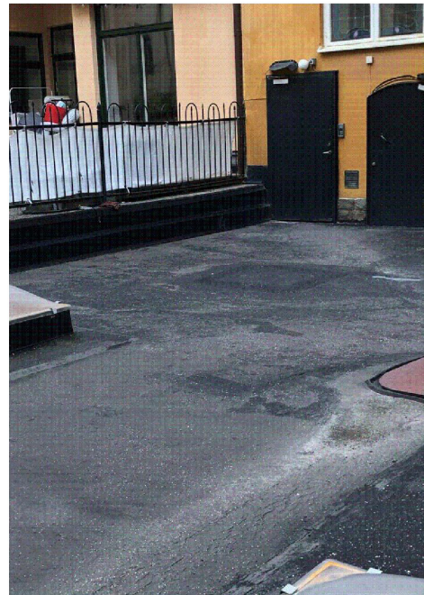
UTGÅNG FRÅN TRAPPHUS. INGÅNG TILL KÄLLARNEDGÅNG, MOT NORDVÄST (BILD 2)