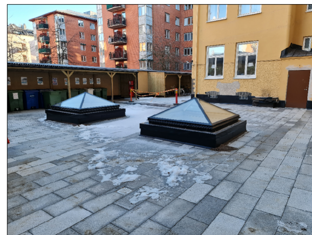
NYA LANTERNINER PÅ GÅRD TYP SCANLIGHT GLASPYRAMID