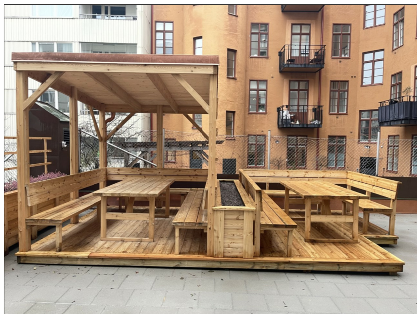
NY SITTGRUPP MED RESP. UTAN TAK