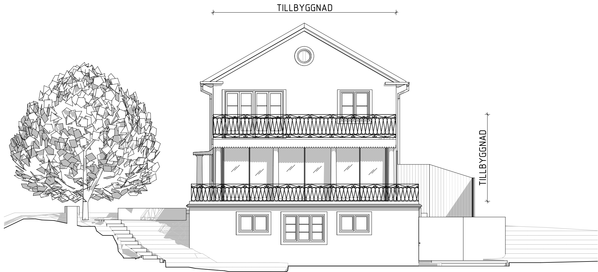
Fasad mot sydväst

Alla mått i millimeter. Nya räcken lika befintligt järnräcke i svart smide. Vita snidade pelare till det nya uterummet av trä i tidstypisk stil. Täckande plåt runt uterummets bjälklag i svart plåt. Skjutdörrar till det nya uterummet i glas med svart metallram.