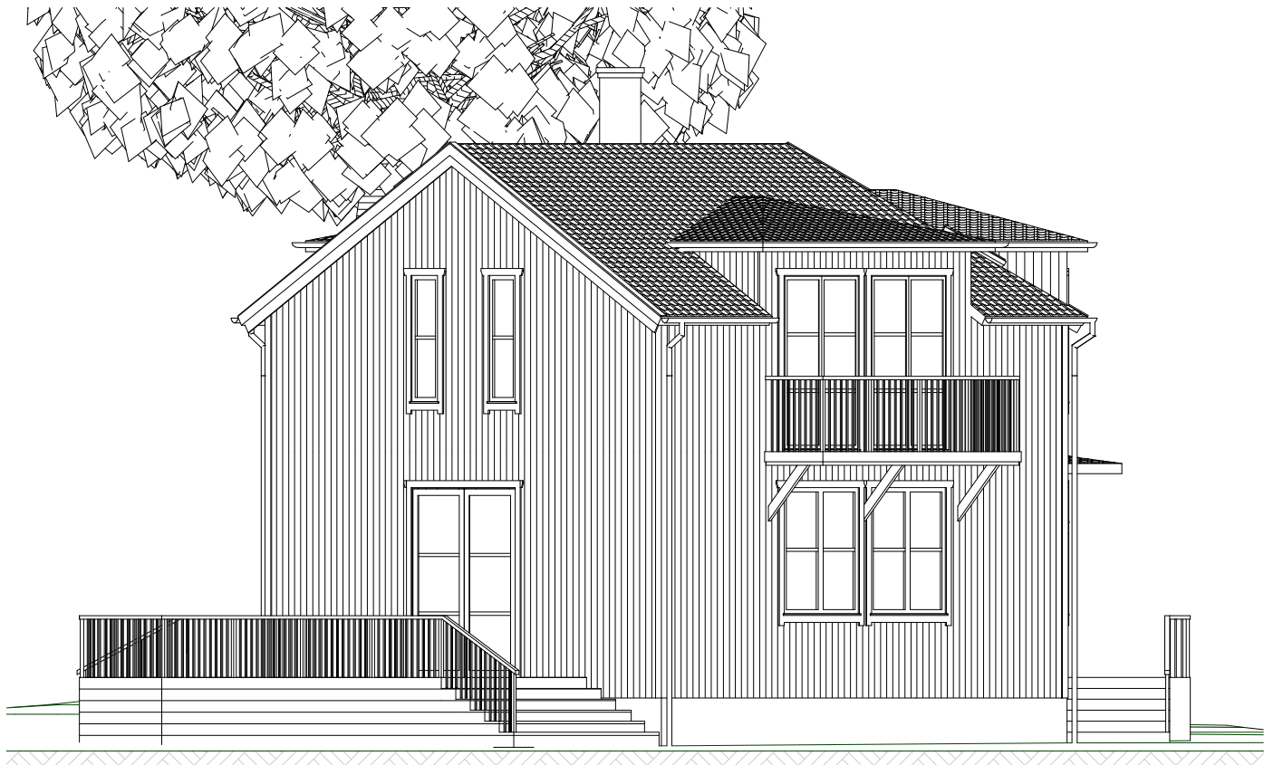
FASAD MOT SYDOST