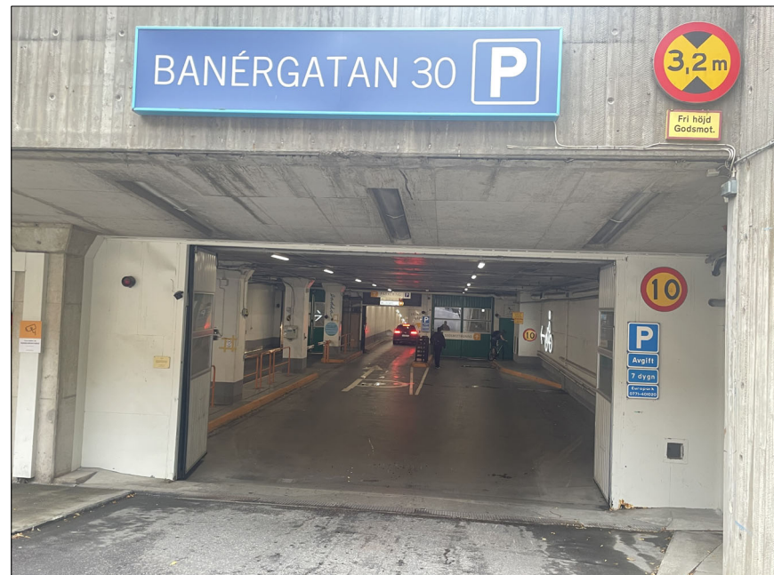
VY 1, BEF IN-/UTFART GODSMOTTAGNING FRI HÖJD 3,2m