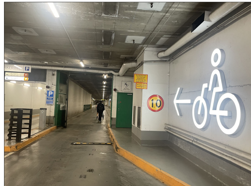
VY 2, BEF IN-/UTFART GODSMOTTAGNING