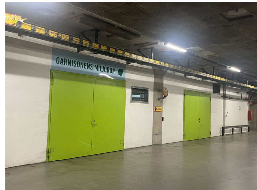
VY 3, DÖRRAR TILL BEF MILJÖRUM. BETONGGOLV, FRI HÖJD 3,2M