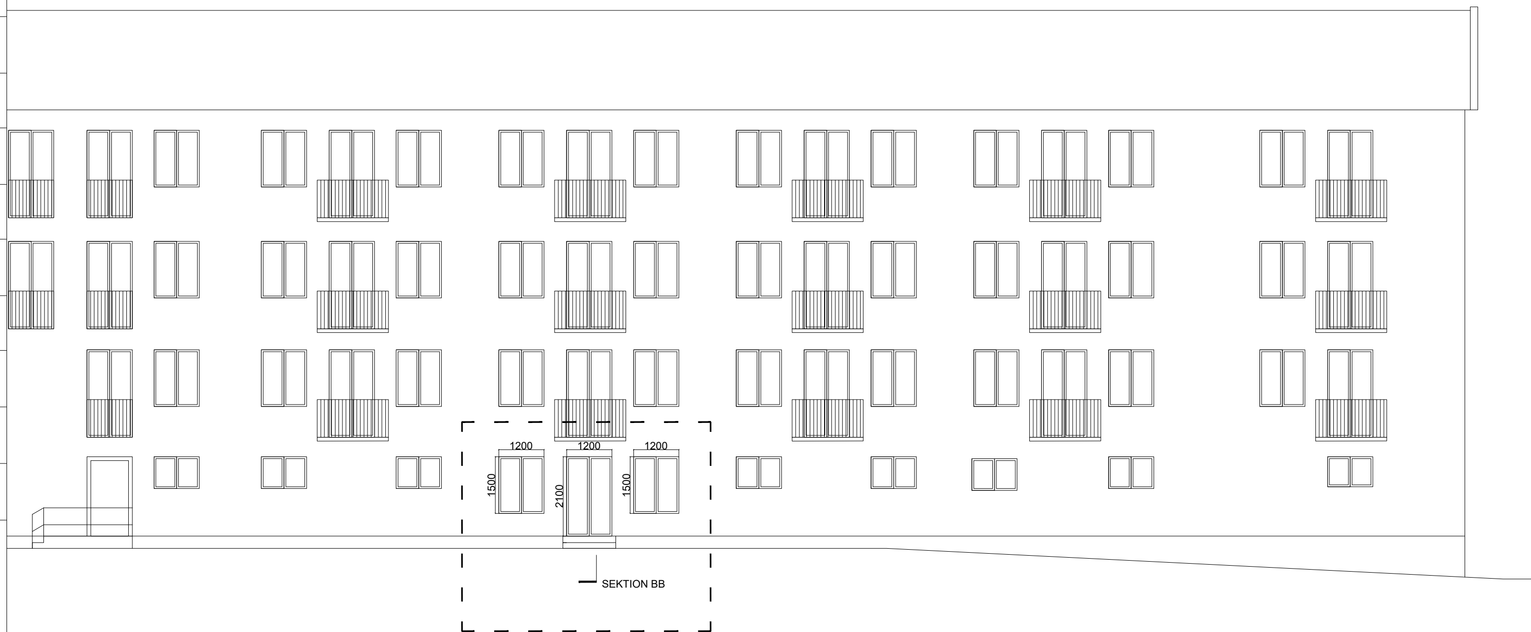
NY SEKTION BB