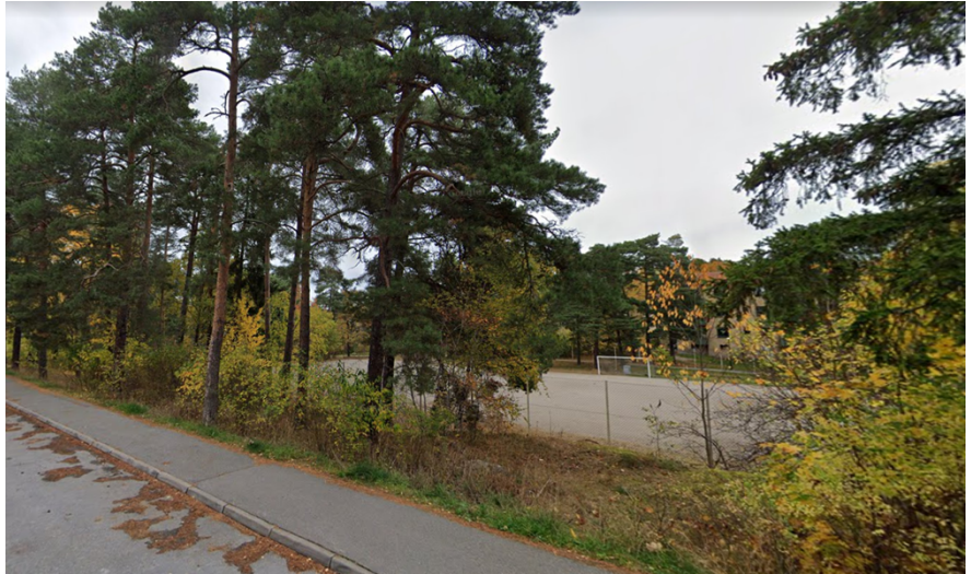
Grusplanen ligger inbäddad i skogsvegetation.