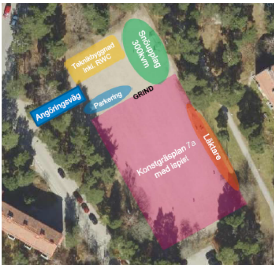
Tidig skiss på möjlig disposition av funktioner.

Förslaget innebär att befintlig grusplan omvandlas till en konstgräsplan med totalmått 63x43 meter, avsedd för spel sju mot sju. Runt planen ska det finnas sittmöjligheter. Nytt stängsel och ny belysning tillkommer. Detaljplanen ska även innefatta en byggrätt för att kunna uppföra en teknikbyggnad med en byggnadsarea på cirka 24 kvadratmeter, och en cirka 300 kvadratmeter stor yta för snöupplag. Cirka 20 platser för cykelparkering och 1 bilparkeringsplats för personer med rörelsenedsättning placeras i anslutning till bollplanen. Teknikbyggnaden och övriga funktioner ryms inom befintlig grusyta norr om fotbollsplanen. Bollplanen ska kunna användas som spontanidrottsyta för skridskoåkning under vintertid, och ska därför förses med utrustning som möjliggör att spola is på konstgräsplanen när vädret tillåter.