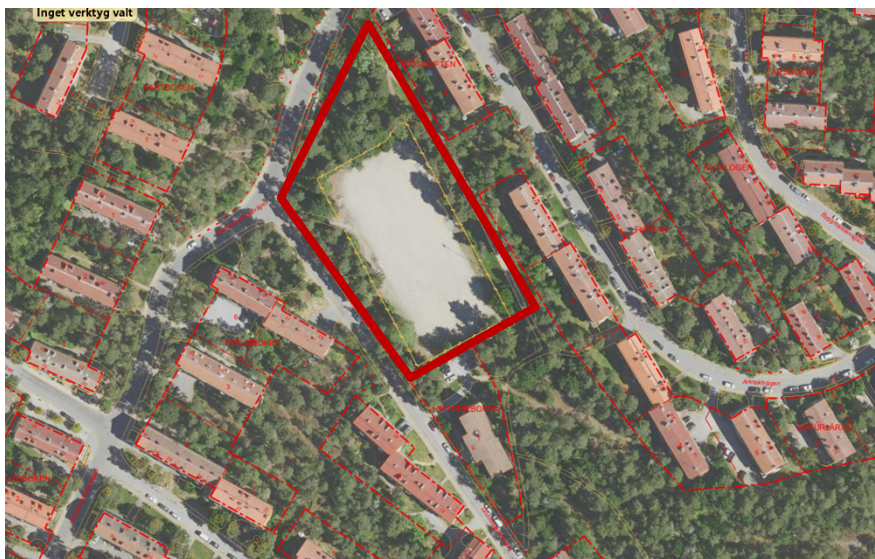
Grusplanen ligger bland smalhusen i Abrahamsberg. Planområdets preliminära avgränsning markerad med röd linje.