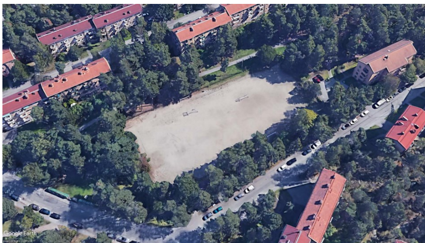
Grusplanen ligger centralt i smalhusområdet.

Grusplanen ligger inbäddad i skogsvegetation i Abrahamsbergs smalhusområde. Bebyggelsen är uppförd efter en stadsplan från 1939 av Albert Lilienberg. Abrahamsberg är ett av Stockholms bäst bevarade och representativa smalhusområden. Stadsdelen kännetecknas av luftiga, hälsosamma bostäder anpassade till terrängen och vegetationen. Resultatet är en stadsdel med snirkliga gator, hus som följer de naturliga sluttningarna och mycket grönska sparat mellan husen. Området visar på 1930-talets nya och ambitiösa sätt att skapa en bra och trivsam boendemiljö. Samtliga byggnader är uppförda i tre våningar. De gula tegelfasaderna och de röda tegeltaken bidrar till ett enhetligt intryck, medan utformningen av fönster, balkongfronter och entréportar ger variation.