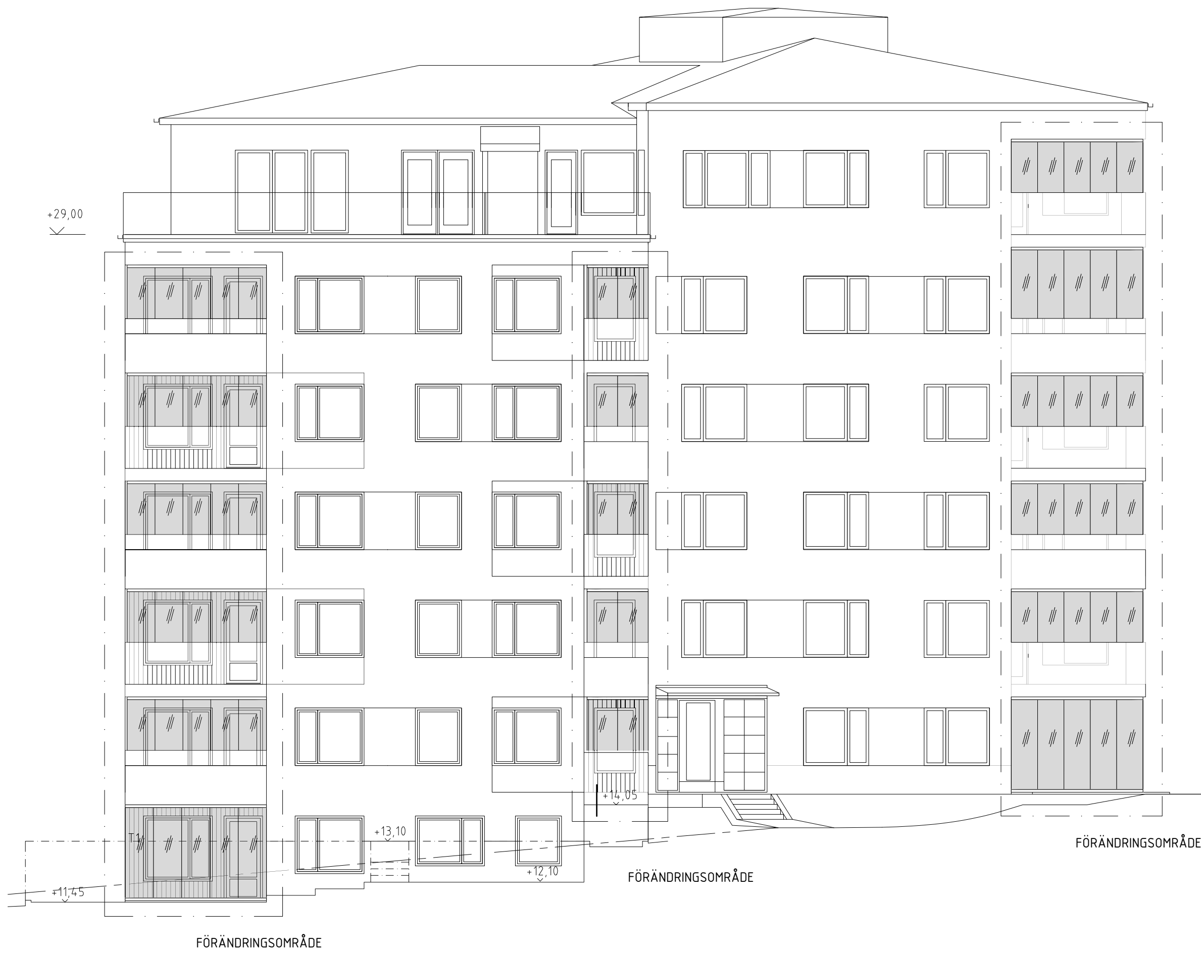
FASAD MOT SYDÖST 2 soA