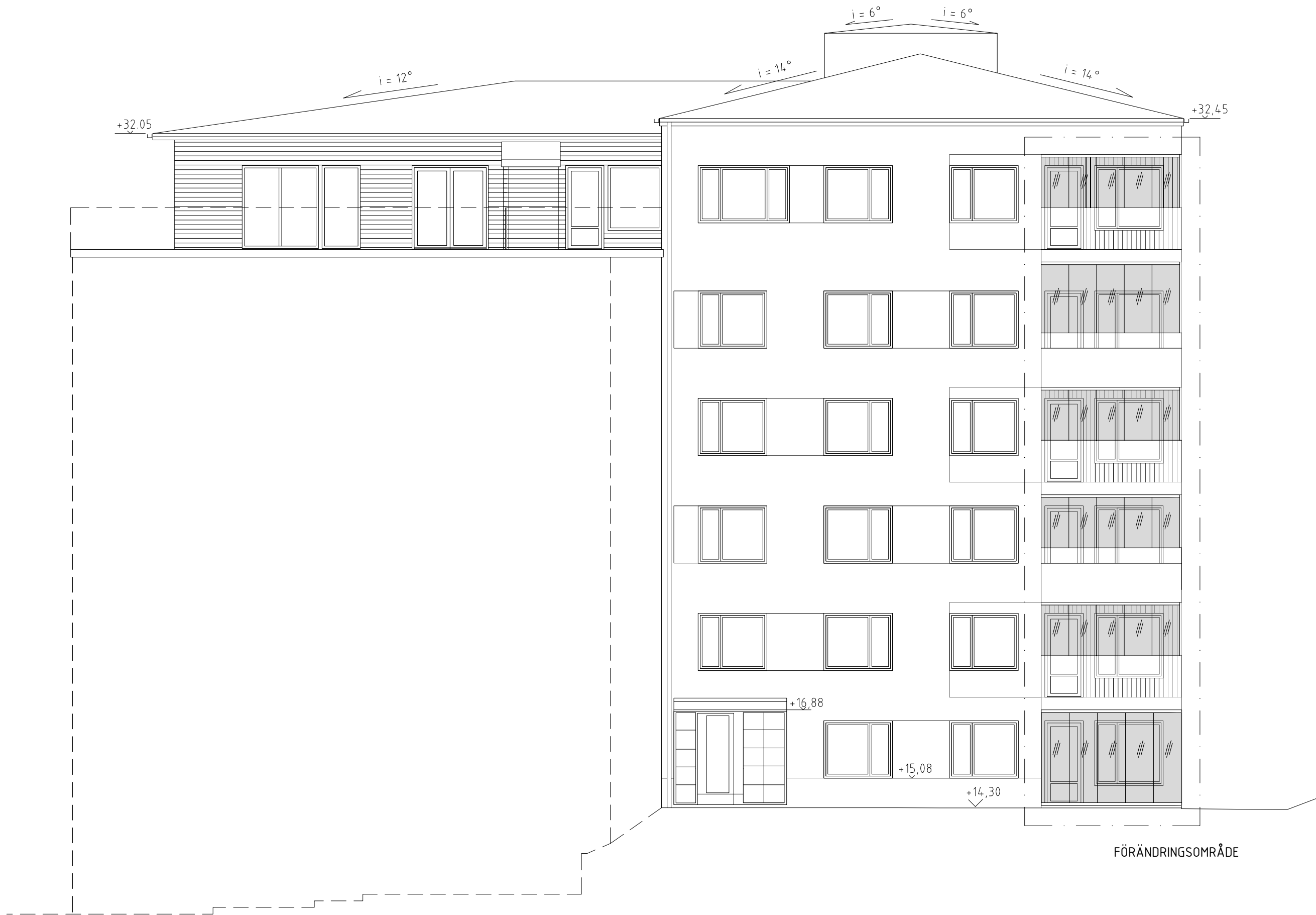
FASAD MOT SYDÖST 2 soB