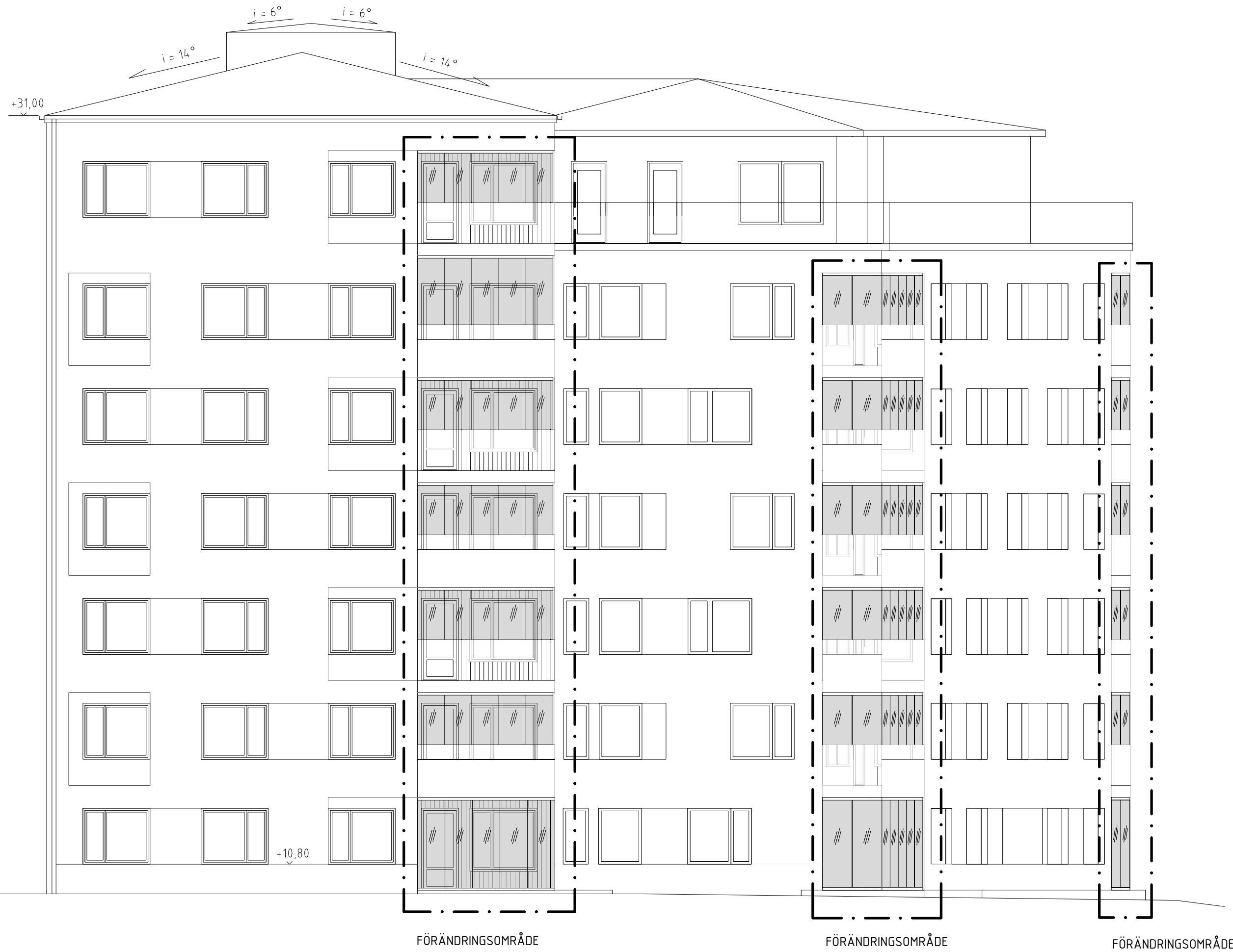
FASAD MOT NORDVÄST 1 nvA