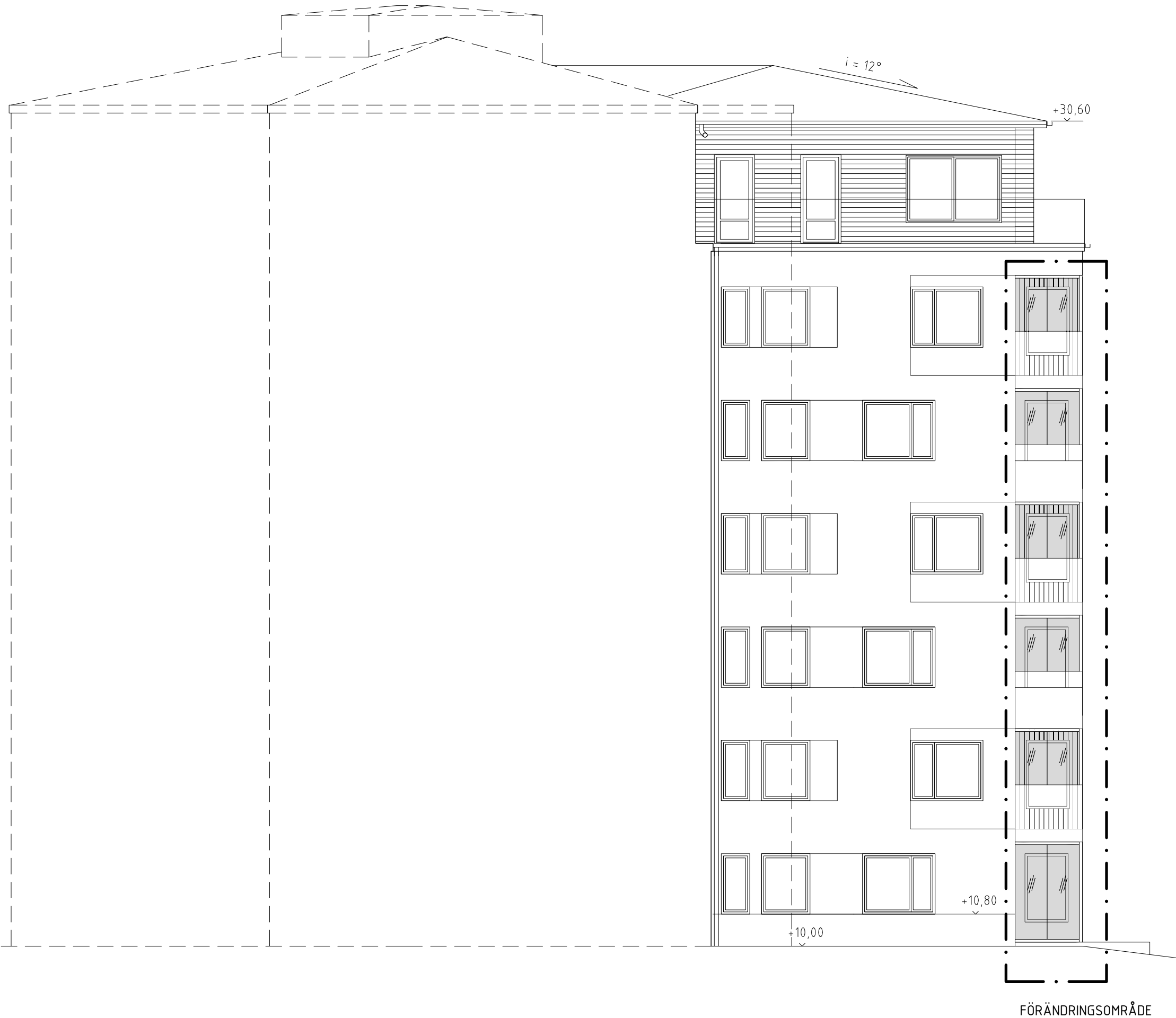
FASAD MOT NORDVÄST 1 nvB