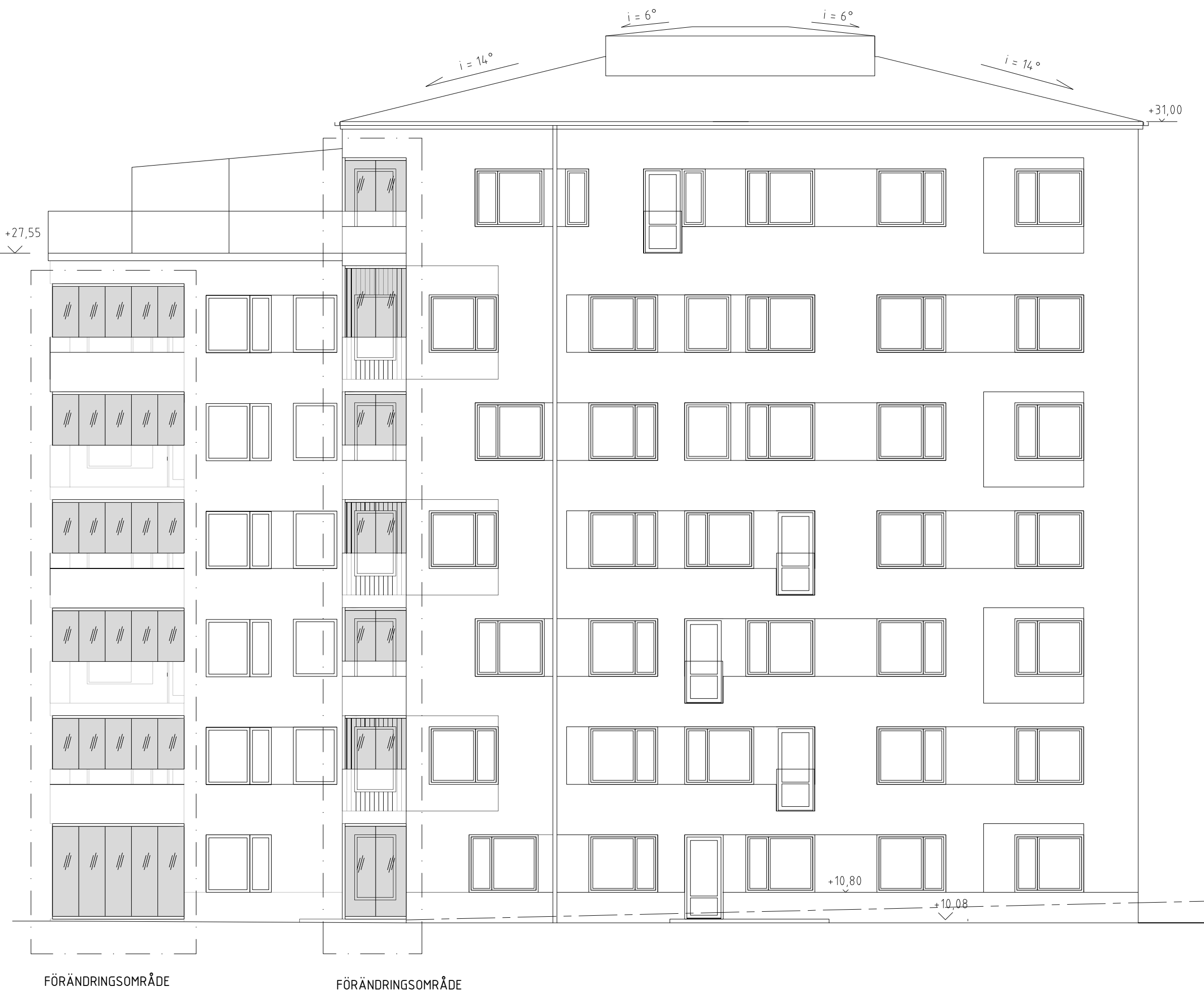
FASAD MOT NORDÖST 1 noA