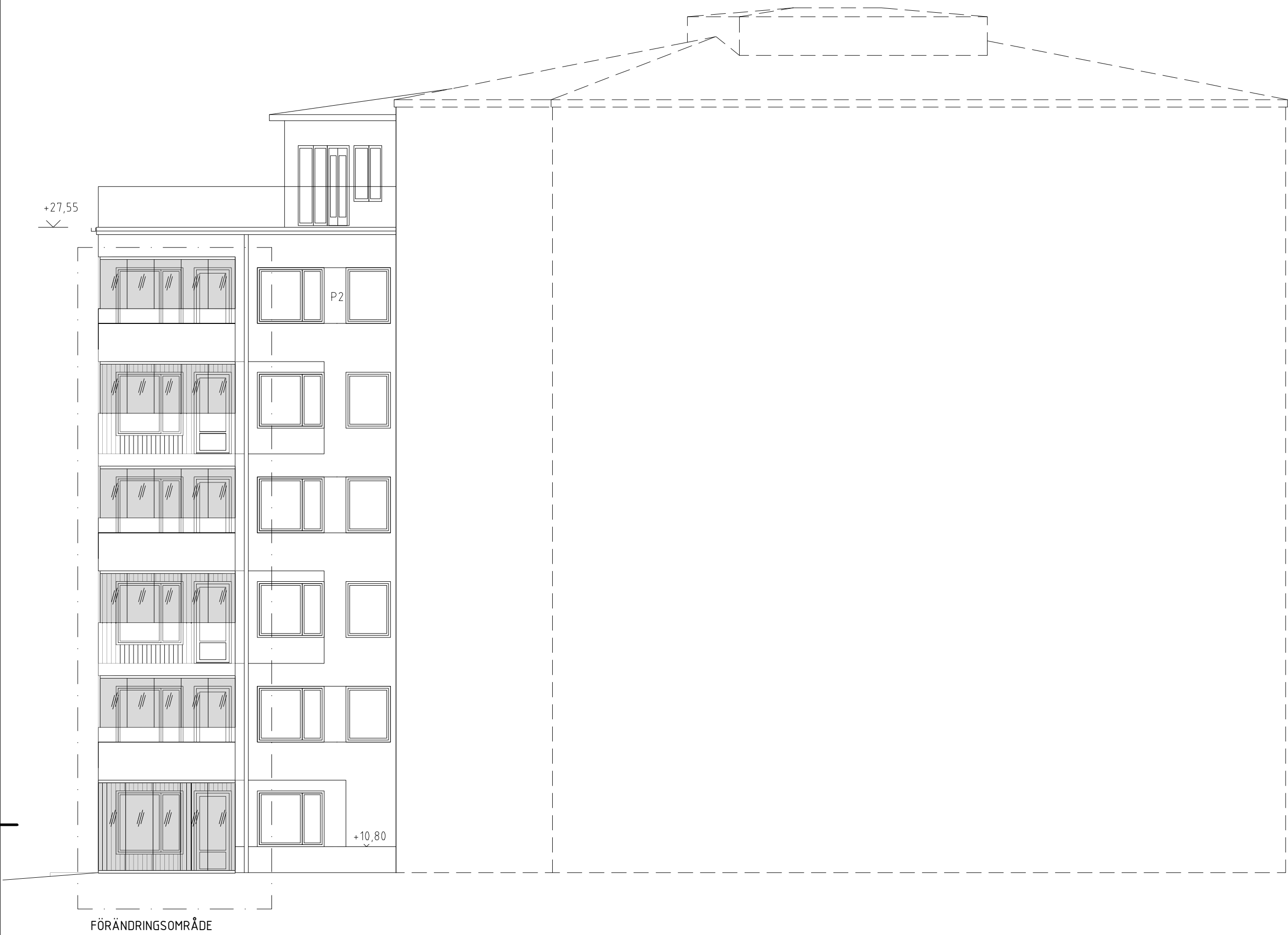
FASAD MOT NORDÖST 1 noB