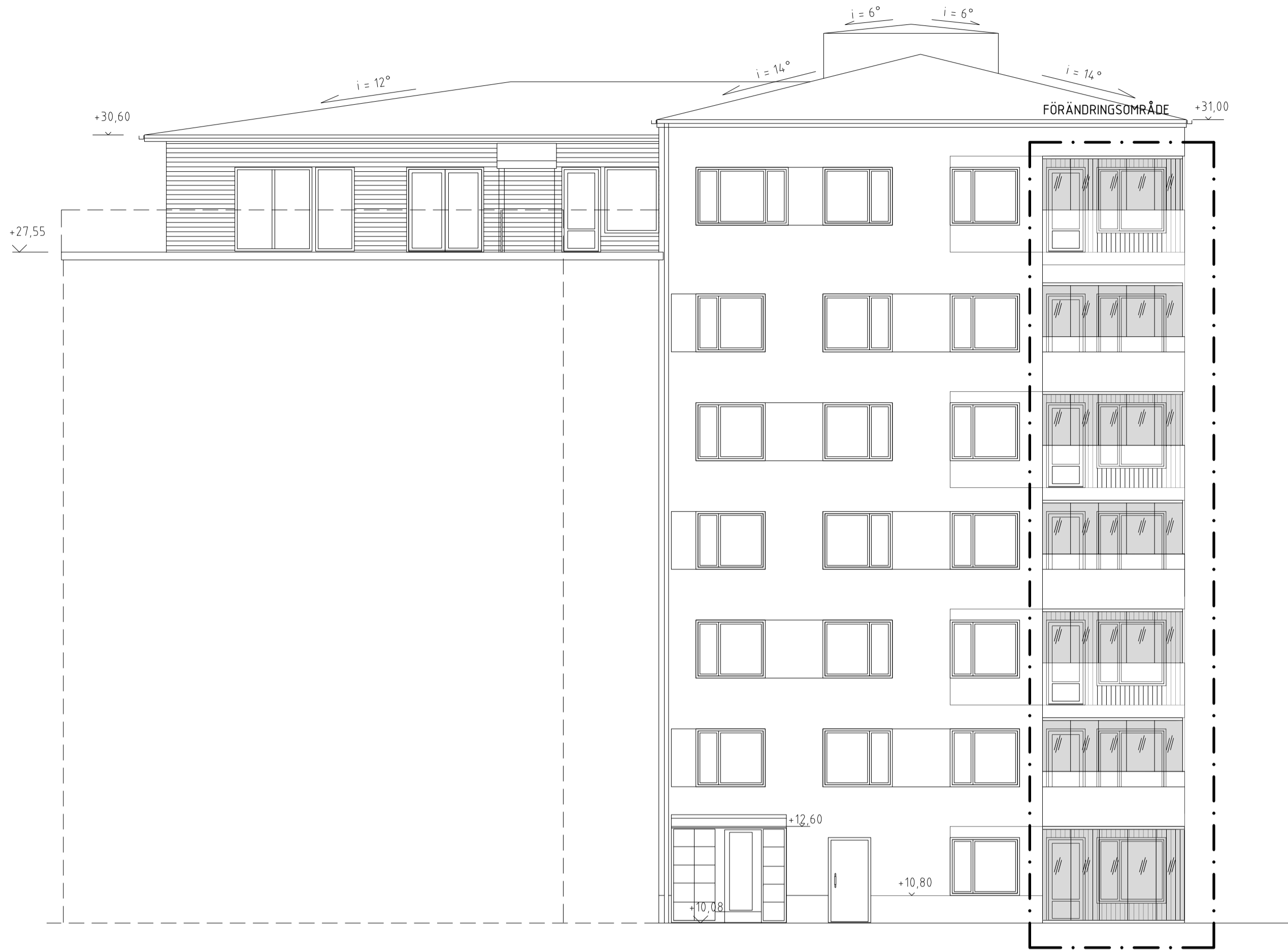
FASAD MOT SYDÖST 1 soB