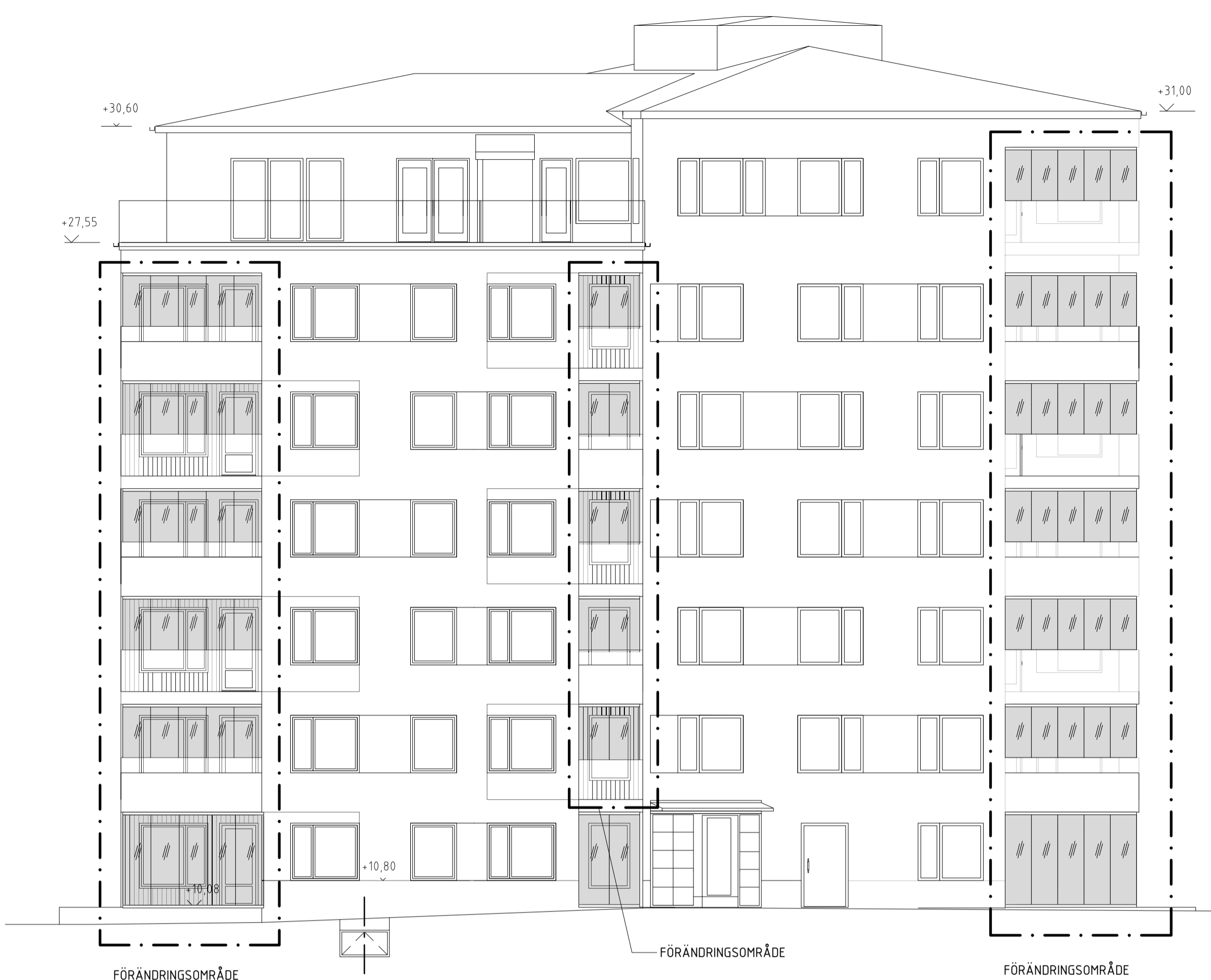
FASAD MOT SYDÖST 1 soA