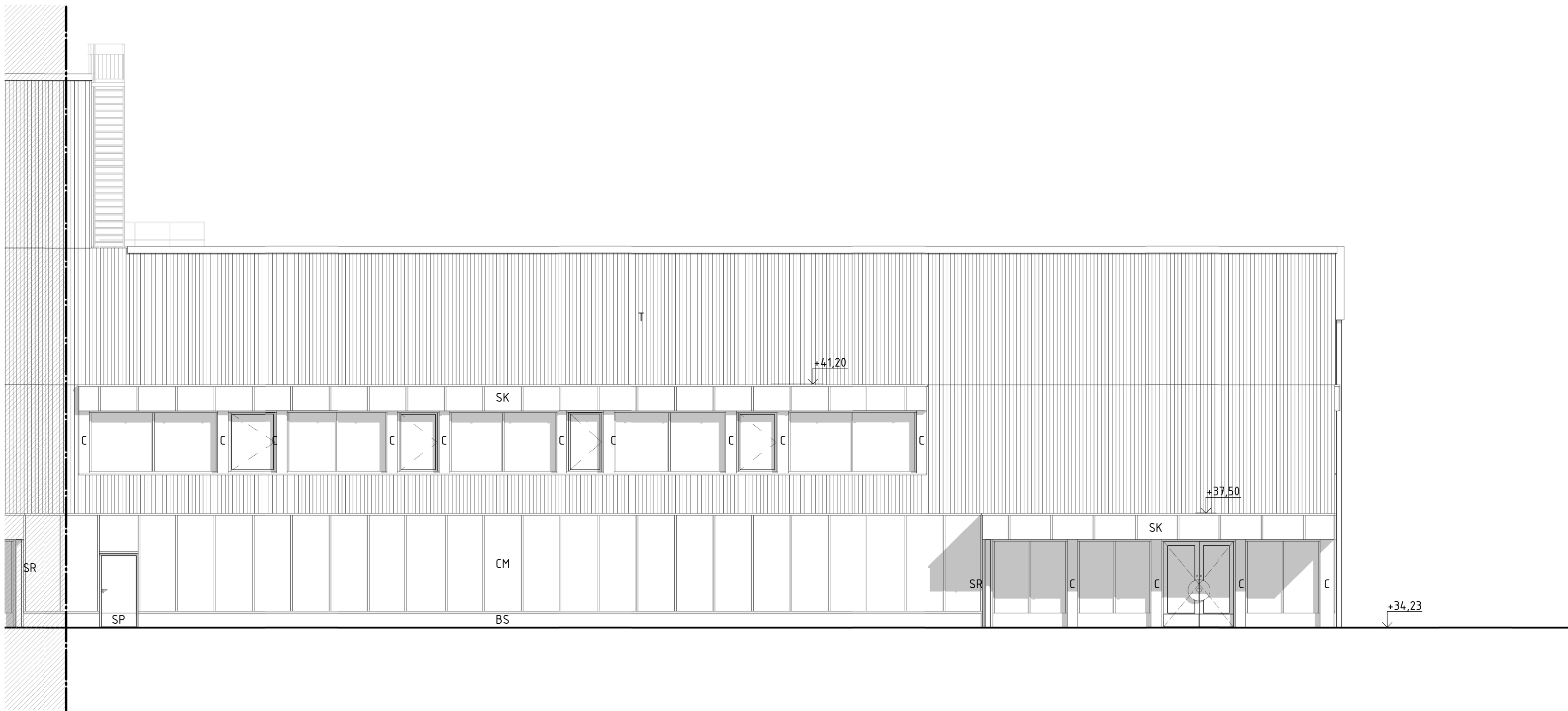
Fasad Sydöst, Del 2