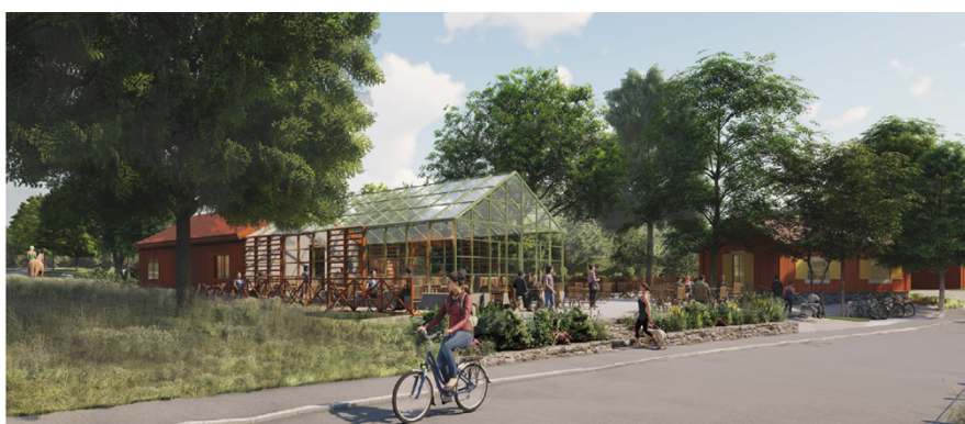
Vy från korsningen Enskede Gårdsväg/ Bägerstavägen. (HMXW arkitekter)