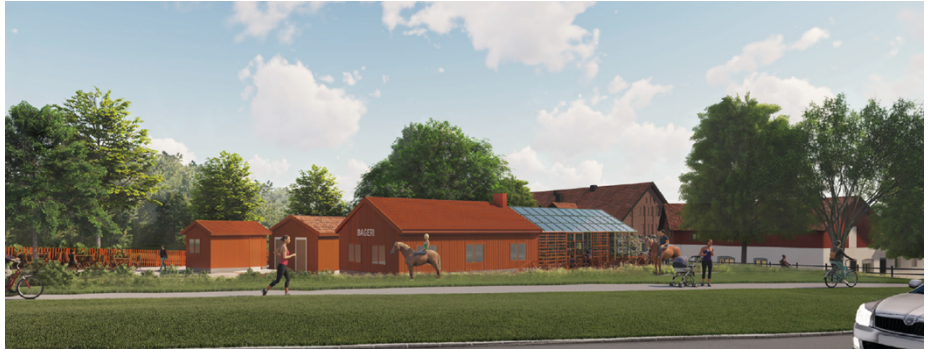
Vy från Bägerstavägen. (HMXW arkitekter)