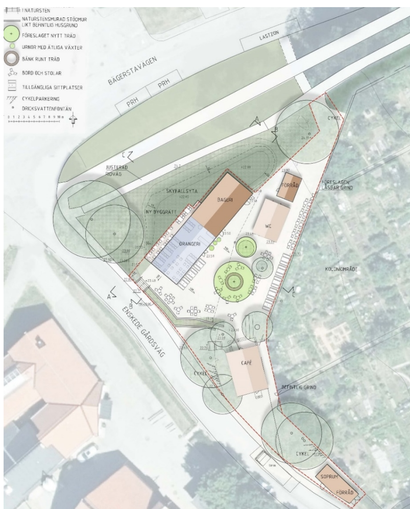
Planillustration med sektionsmarkeringar. Befintlig bebyggelse inom planområdet utgörs av kafé och WC i ljus färg och nya byggnader bageri förråd och soprum i mörk färg. (Horn, Uggla)

Planen innebär att markanvändningen i östra delen av planområdet ändras från huvudsakligen parkmark och odling till kafé, restaurang med kompletterande gårdsbutik och samlingslokal, vilket säkerställer befintlig verksamhet. Planen möjliggör även en ny byggnad för bageri och servering samt förråd och miljöstuga. Längs med del av serveringsbyggnad möjliggörs en brygga på pålar för uteservering. Fyra skyddsvärda och karaktärsskapande träd säkerställs med skyddande bestämmelse mot fällning. För att möjliggöra fler byggnader behöver cirka 10 träd fällas. Planen säkerställer ett område för fördröjning av dagvatten vid skyfall, vilket påverkar del av befintlig ridstig i väster som behöver flyttas cirka 3 meter närmare Bägerstavägen.