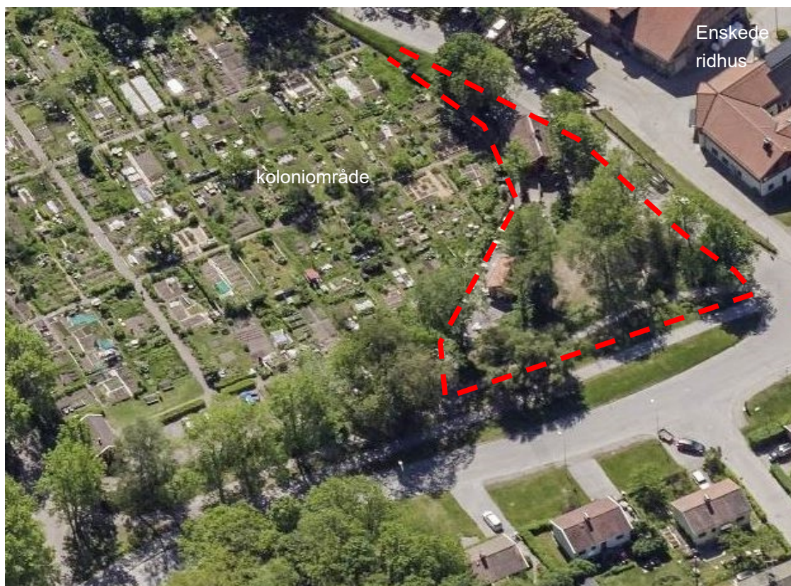
Snedbild över planområdet från väster. Området gränsar i öster till ett koloniområde och i söder till Enskede ridskola och Enskede Gårdsväg. I norr gränsar planområdet till en ridväg utmed Bägerstavägen.

Inom planområdet finns en liten stuga och ett tillhörande förråd. Stugan är före detta trädgårdsmästarbostaden till Enskede Gård och används i dag som café och bageri av Enskedeparkens bageri. Byggnaden är blåklassad (högsta klass) i Stadsmuseets kulturhistoriska klassificering och ingår i den kulturhistoriskt värdefulla miljön vid Enskede gård. Marken består till stor del av naturmark med träd. I öster mot koloniområdet finns en grusad gångväg och uteserveringsyta. Inom planområdet finns en svacka som har betydelse för dagvattenfördröjning. Det finns flera skyddsvärda träd inom planområdet varav två bedöms som särskilt skyddsvärda.