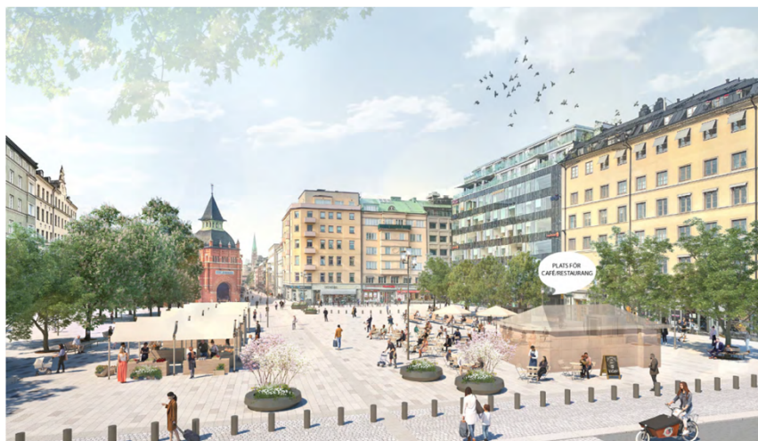
Figur 3. Illustration av upprustningen av Östermalmstorg (Karavan landskap, 2022).

Under projekteringen för upprustningen av Östermalmstorg har intresset att uppföra två caféer/restauranger på torget uppkommit. Det är inte möjligt inom ramen för gällande detaljplan. För att möjliggöra detta behöver en ny detaljplan tas fram som möjliggör för större komplementbyggnader som kiosk/restaurangbyggnader, med tillhörande funktioner inom allmän platsmark.