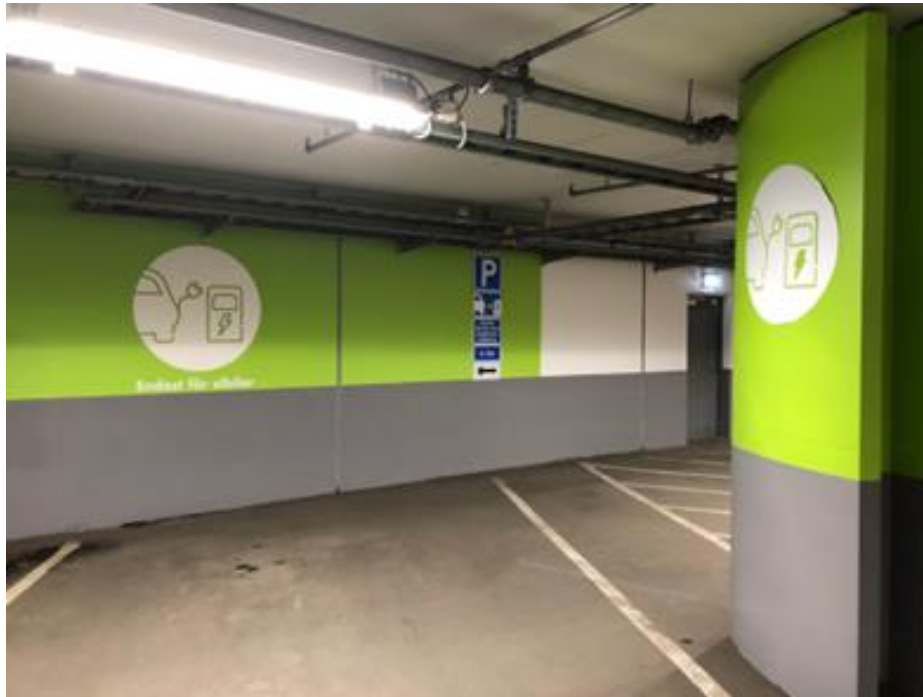
Inspirationsbild med tydlig markering från Centrumgaraget i Vällingby

Ytterligare 17 parkeringsplatser finns längs lokalgatan.