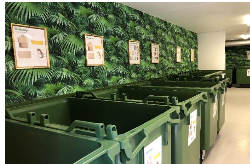
Bild från miljörum i ByggVestas projekt Colonia i Linköping byggt 2021

I kvarteret finns möjlighet till källsortering av alla fraktioner inklusive grovsopor, då behöver man inte bil för sopsortering. För att förbättra känslan – och förhoppningsvis därmed viljan att sortera rätt bygger ByggVesta extra fina miljörum med tapeter och ur högtalare kan fågelkvitter höras. Artiklar för återbruk /second hand kan dock behöva transporteras. Där vill vi hellre använda oss av appen Your Block.