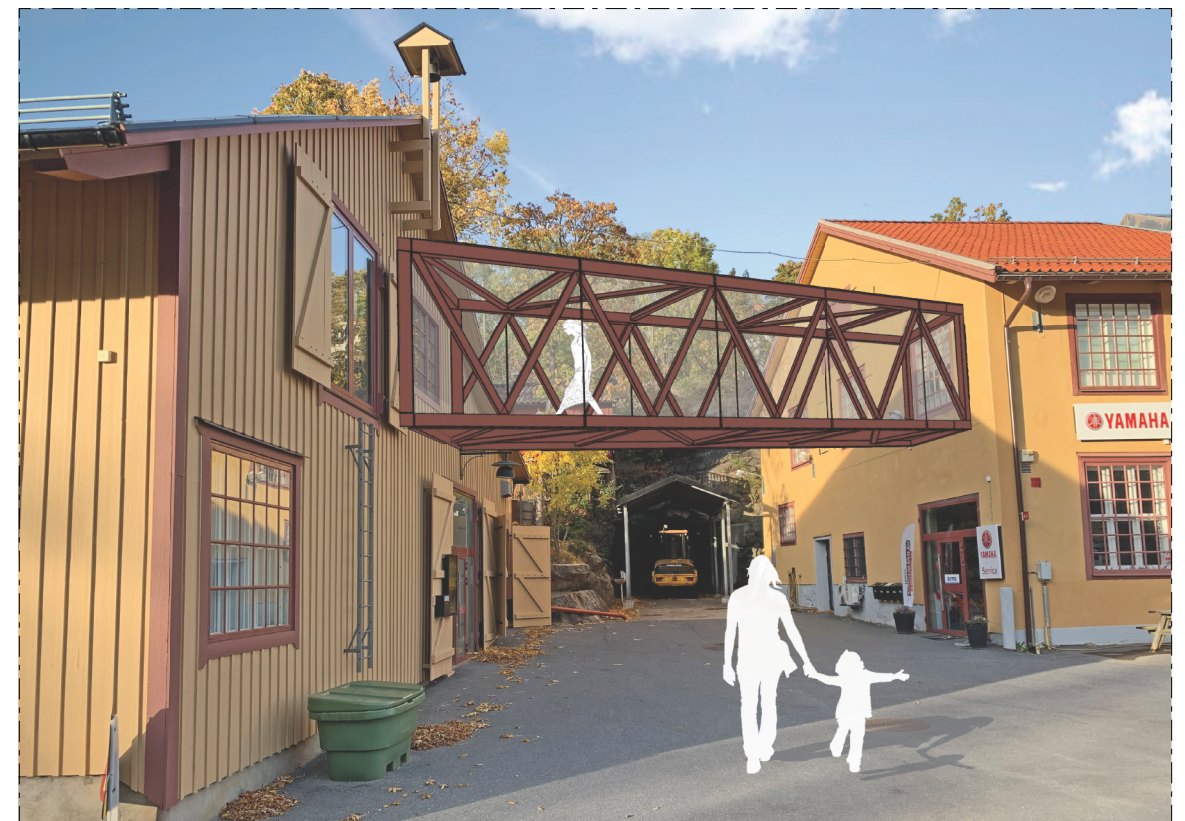
ILLUSTARTION NY GLASLÄNK