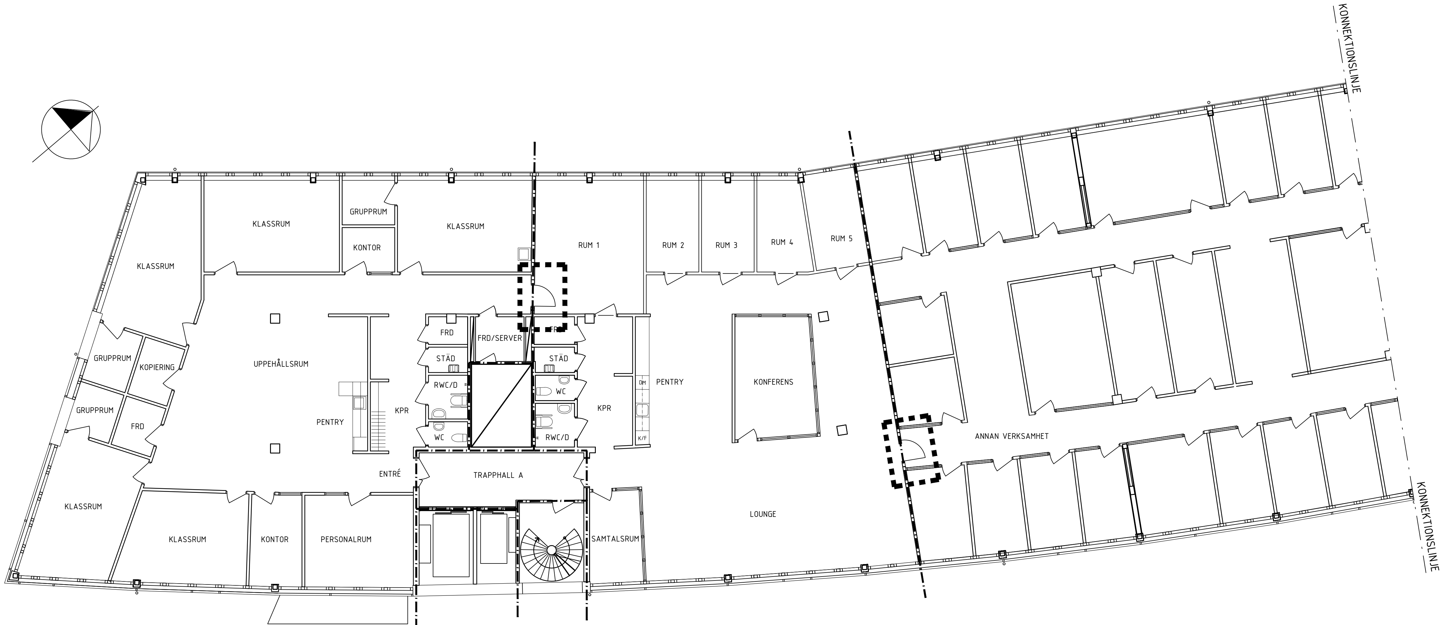
PLAN 4, SKALA 1:100