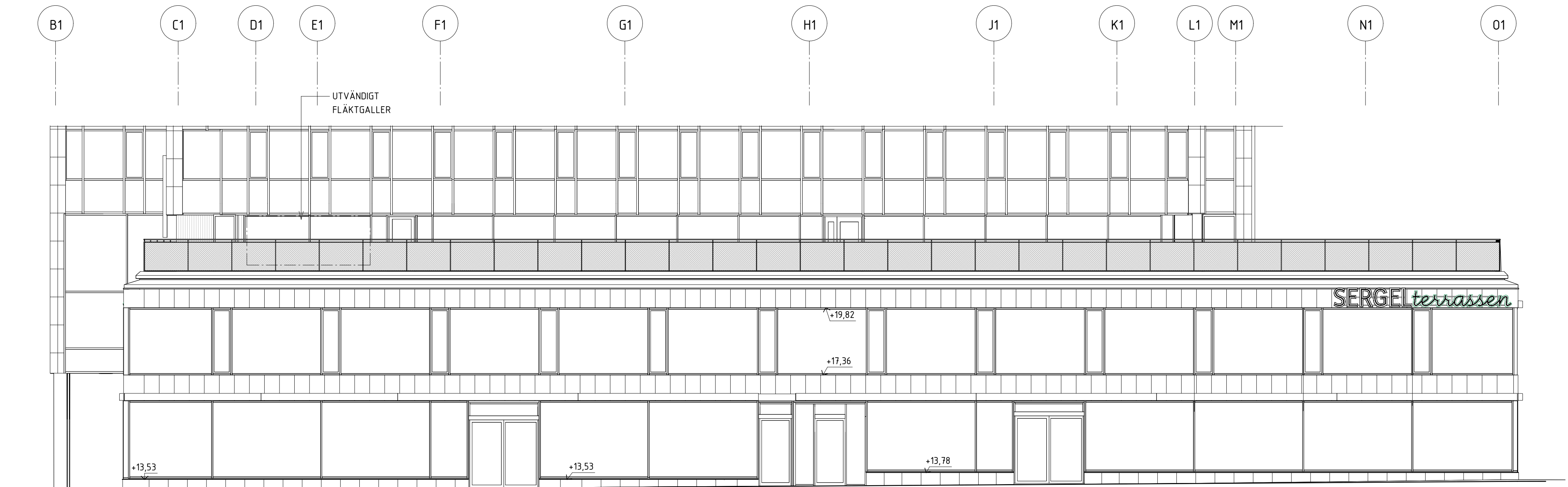
FASAD MOT HÖTORGET_NORR

ALLMÄNNA FÖRESKRIFTER SE A--00.0-0100000