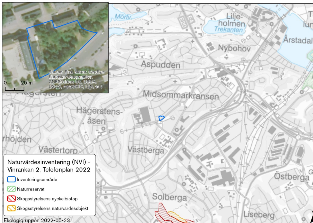
Figur 1. Översiktskarta över inventeringsområdets läge och relation till kända naturvärden i omgivande landskap. Kända artfynd redovisas ej i kartan. Bakgrundskartan är Lantmäteriets topografiska webbkarta respektive ortofoto.

Inventeringsområdet ligger centralt vid Telefonplan i sydvästra Stockholm. Läge och avgränsning framgår av Figur 1. Där framgår också områdets relation till kända naturvärden i omgivande landskap.