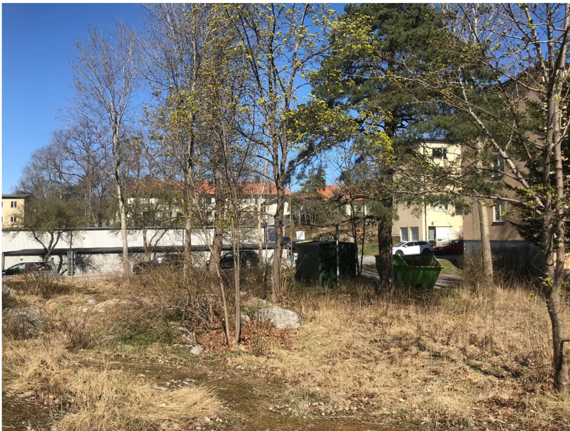
Figur 4. Öppen hållmark med påtagligt naturvärde. I objektet finns rikt inslag av nektarväxter i fältskiktet, något som skapar goda förutsättningar för att området ska nyttjas som födosökmiljö av pollinerande insekter.