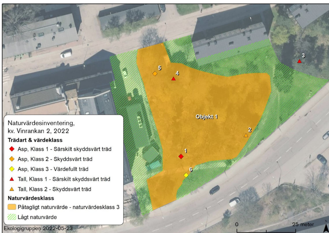
Figur 3. Ett naturvärdesobjekt med påtagligt naturvärde har avgränsats inom det inventerade området. Sex naturvårdsträd har mätts in, varav tre som bedöms vara särskilt skyddsvärda: två mycket gamla tallar samt en äldre asp med en utvecklad hålighet i stammen.

Naturvärdesobjekt har inget direkt lagligt skydd men i miljöbalkens inledande paragraf (1 kap. 1 §) anges att lagen ska tillämpas så att värdefulla naturmiljöer skyddas och vårdas samt att den biologiska mångfalden bevaras. Miljöbalkens hushållningsbestämmelser (3 kap. 3 §) anger dessutom att mark- och vattenområden som är särskilt känsliga från ekologisk synpunkt skall så långt som möjligt skyddas mot åtgärder som kan skada naturmiljön.