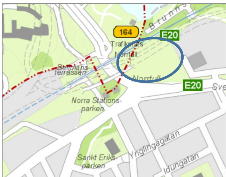
Karta: Kv. Ormträsket 1, Östra Hagastaden, Stockholm

Karaktäristiska skillnader mellan Hagastaden och centrala Norrmalm kan vara en förklaring till ett högre parkeringstal i Hagastaden. Området i detaljplanen omfattas av samma parkeringstal oavsett boendeform. Därefter finns möjlighet att sänka parkeringstalen med mobilitetsåtgärder.