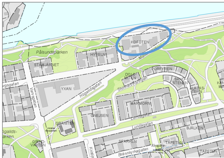
Karta: Kv Kofoten på västra Södermalm Stockholm