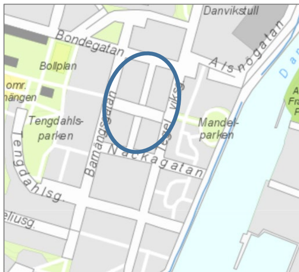
Karta: Kv. Persikan, Södermalm, Stockholm

Många bostäder på Södermalm är små, vilket i sin tur påverkar områdets generella parkeringstal. Bostäderna i kvarteret beräknas att vara större än de planerade seniorbostäderna. Då detaljplanen anger samma parkeringstal för hela området är parkeringstalet beräknat utifrån lägenheternas genomsnittliga storlek. Därför finns det underlag att ifrågasätta det höga parkeringstalet för seniorbostäderna, då mobilitetsbehovet för dessa är lägre i kombination med att boendeytan är mindre.