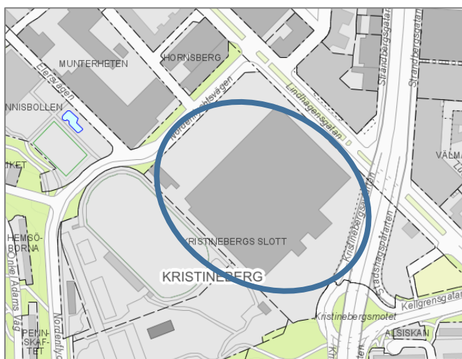
Karta: Kv. Kristinebergs slott, Västra Kungsholmen, Stockholm

Parkeringsstalet avgörs av boendeytan och inte av bostädernas karaktär och målgrupp, vilket förklarar parkeringsstalets variation i detaljplanen. Lägenheterna med lägre parkeringstal är mindre än seniorbostäderna. Samtidigt har båda lägenhetstyperna ett lägre parkeringstal än stadsdelens generella nivå vilket stödjer resonemanget om att seniorbostäders parkeringsbehov är lägre än vanliga bostäders parkeringsbehov även om boendeytan är samma.