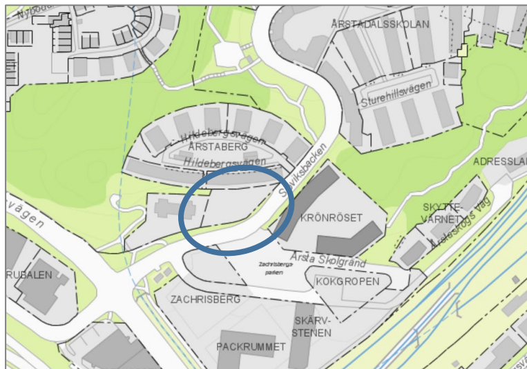
Karta: Kv. Årstaberg 1, Årstaberg, Stockholm

Seniorbostäderna i Årstadal har tilldelats ett lägre parkeringstal än stadsdelens generella rekommendationer. En anledning till detta kan vara förväntat lägre bilnehav för seniorboende jämfört med vanliga bostäder eller införande av mobilitetsåtgärder.