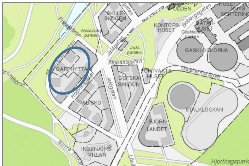
Karta: Kv. Garphyttan, Norra Djurgårdsstaden, Stockholm

I detaljplanen motiveras ett lägre parkeringstal med hänsyn till seniorboendes lägre mobilitets- och resebehov och mindre boendeyta. Det finns möjlighet att använda motsvarande resonemang för Stiftelsen Borgerskapet för att motivera ett lägre parkeringstal för de planerade lägenheterna.