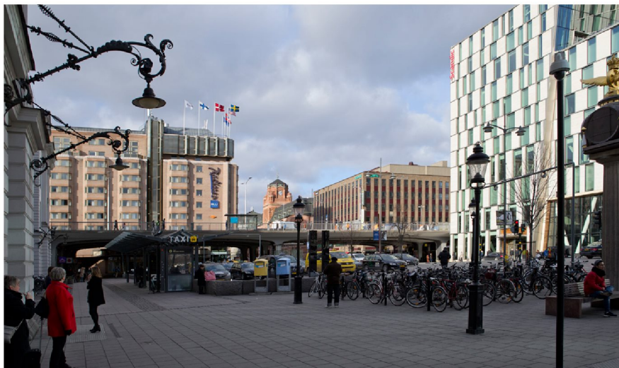
Vy från Centralplan. Fotot illustrerar befintlig situation.