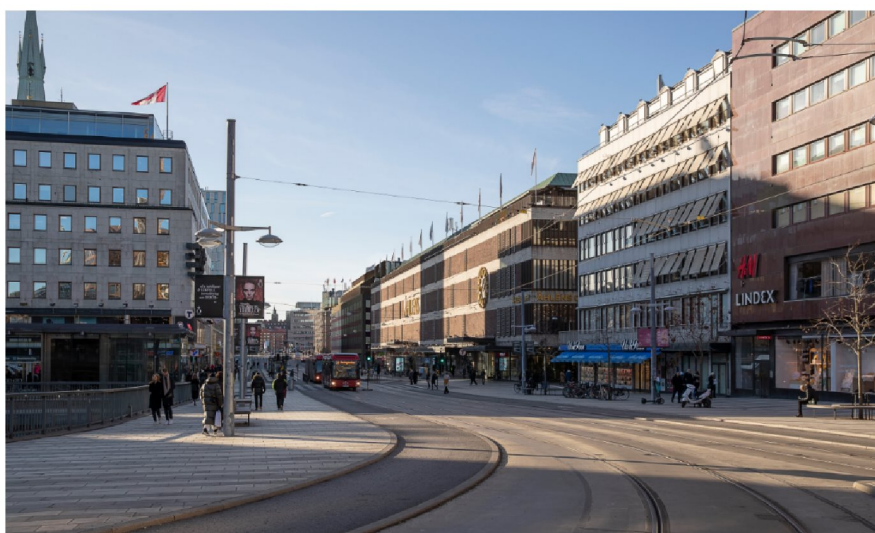
Illustration av detaljplaneförslag, Vy från Klarabergsgatan/Sergels torg. Illustrationen redovisar befintlig byggnadsvolym, föreslagen påbyggnad och takterrass. Arkitekt: