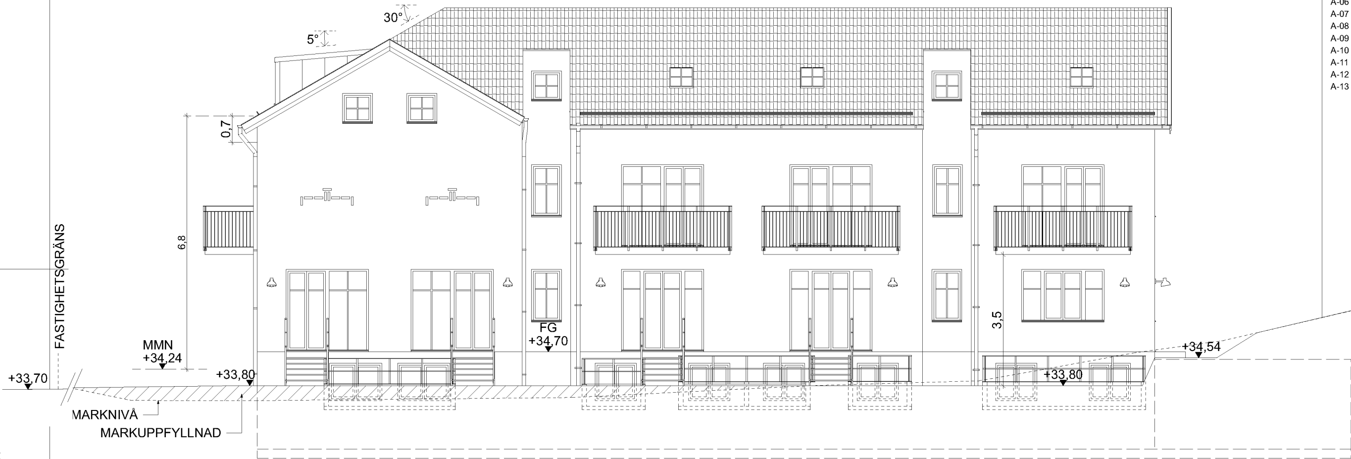
FASAD A1 MOT SÖDER