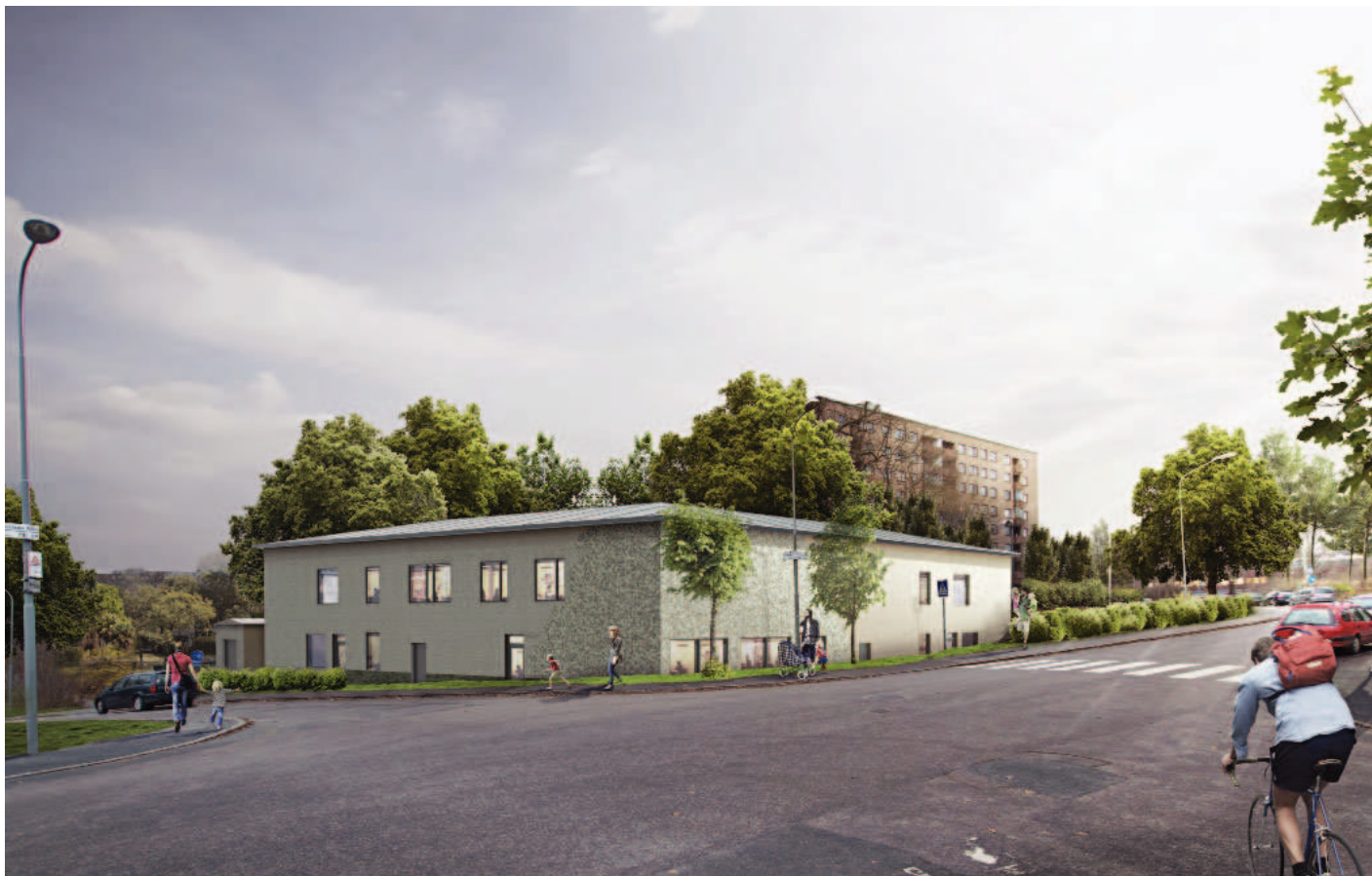
Perspektiv från Hägerstens allé

Förskolan placeras i foden av ett gröonstråk, och öppnar upp sig mot detta med entréer och förskolegård. Förskolan länkar skivhusbebyggelse med radhusslingor och sluter gaturummet. Det visuella sambandet med gröonstråket bibehålls via södra gångvägen från Hägerstens allé.