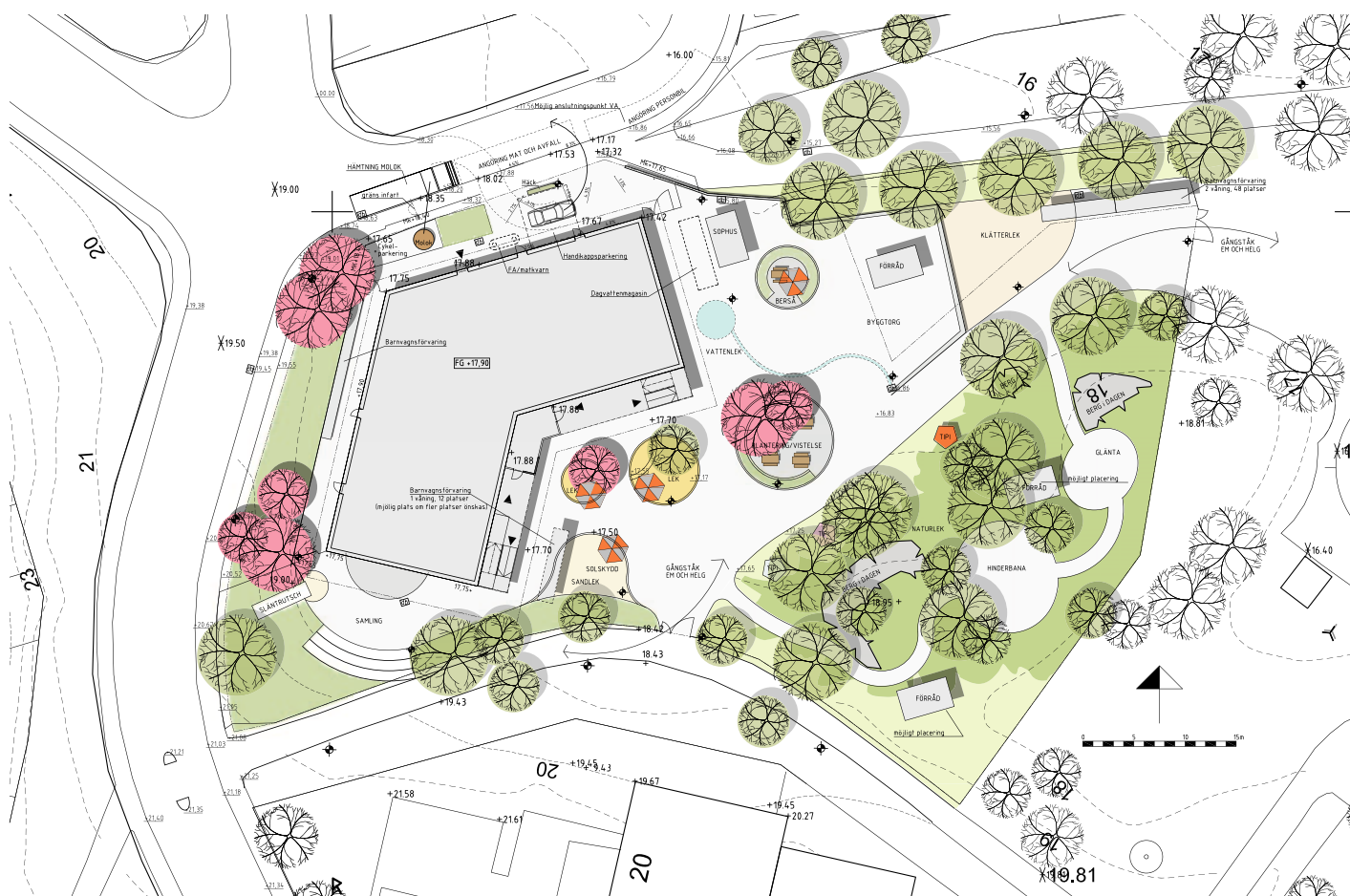
Illustrationsplan över förskolegården

Maja myra förskola är en föreslagen ny förskola i två plan belägen i stadsdelen Hägersten i Stockholm. Förskolan planeras för åtta avdelningar eller ca 150 barn.