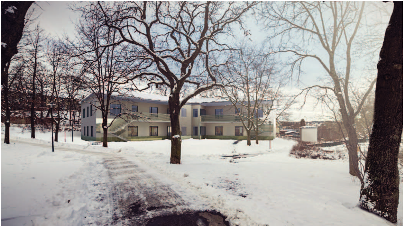
Perspektiv från Parksidan