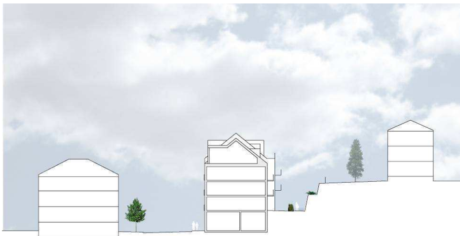
Sektion 1 (Illustration: Brunnberg & Forshed/Tema landskapsarkitekter).