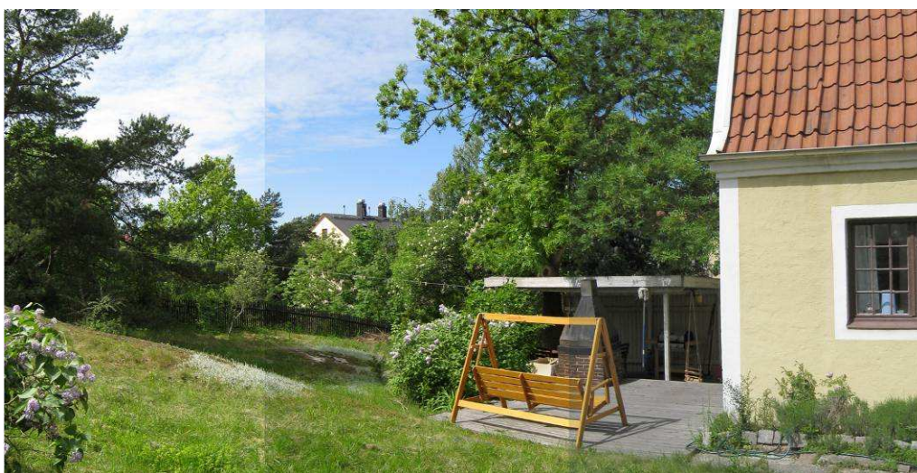
Trädgården vid villan på fastigheten Martallen 34.