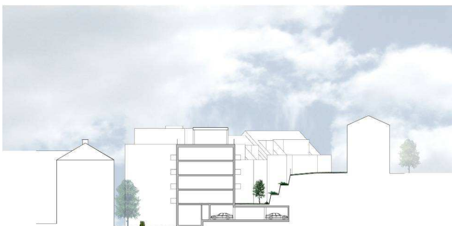
Sektion 2 (Illustration: Brunnberg & Forshed/Tema landskapsarkitekter).