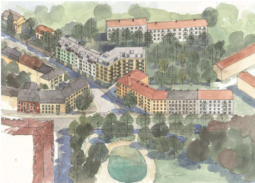
Fågelperspektiv från torget (Illustration: Brunnberg & Forshed/Tema landskapsarkitekter).

I det nordvästra hörnet bildar huset hörn mot den nya torgytan mot Svandammsparken. Hörnet markeras genom en högre byggnadsdel i fem våningar plus indragen takvåning. I hörnet och längs bottenvåningen mot Svandammsvägen placeras bostadsentréer och lokaler.