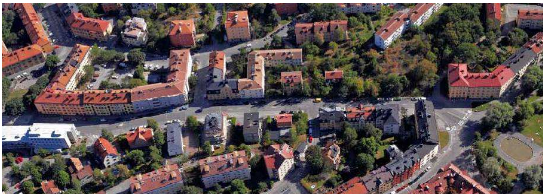
Svandammsvägen sedd mot söder. Planområdet utgörs av naturpartiet mot gatan i övre högra hörnet.

Östra delen av planområdet, fastigheten Martallen 34, utgörs av en äldre villatomt med höga kulturvärden. Villan har enligt stadsmuseets klassificering stort kulturhistoriskt värde, grön färg på kartan. Bostadshuset är uppfört 1922 och trädgården ligger upphöjt från gatan. Höjdskillnaden tas upp av en stenmur vilken ger en tydlig rumslik avgränsning av gatan. Gatan in i kvarteret är smal och används främst till parkering för intilliggande fastigheter. Vändplan saknas.