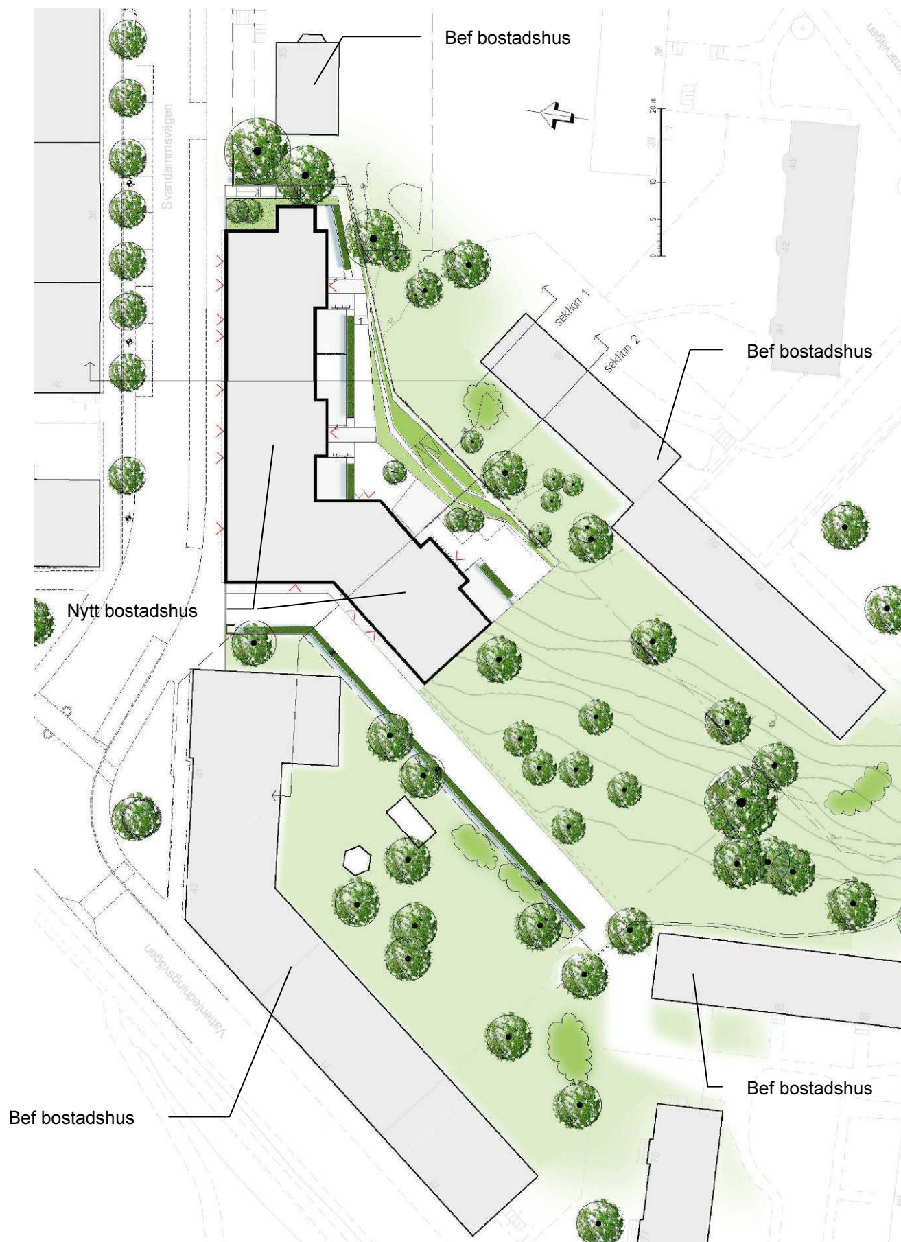
Situationsplan (Illustration: Brunnberg & Forshed/Tema landskapsarkitekter).