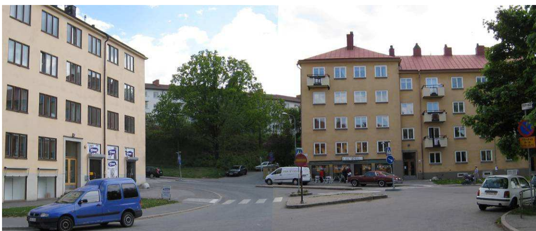
Planområdet vid Svandammsvägen, sett från Svandammsparken.

Östra delen av planområdet, fastigheten Martallen 34, utgörs av en äldre villatomt med höga kulturvärden. Villan har enligt stadsmuseets klassificering stort kulturhistoriskt värde, grön färg på kartan. Bostadshuset är uppfört 1922 och trädgården ligger upphöjt från gatan. Höjdskillnaden tas upp av en stenmur vilken ger en tydlig rumslik avgränsning av gatan. Gatan in i kvarteret är smal och används främst till parkering för intilliggande fastigheter. Vändplan saknas.