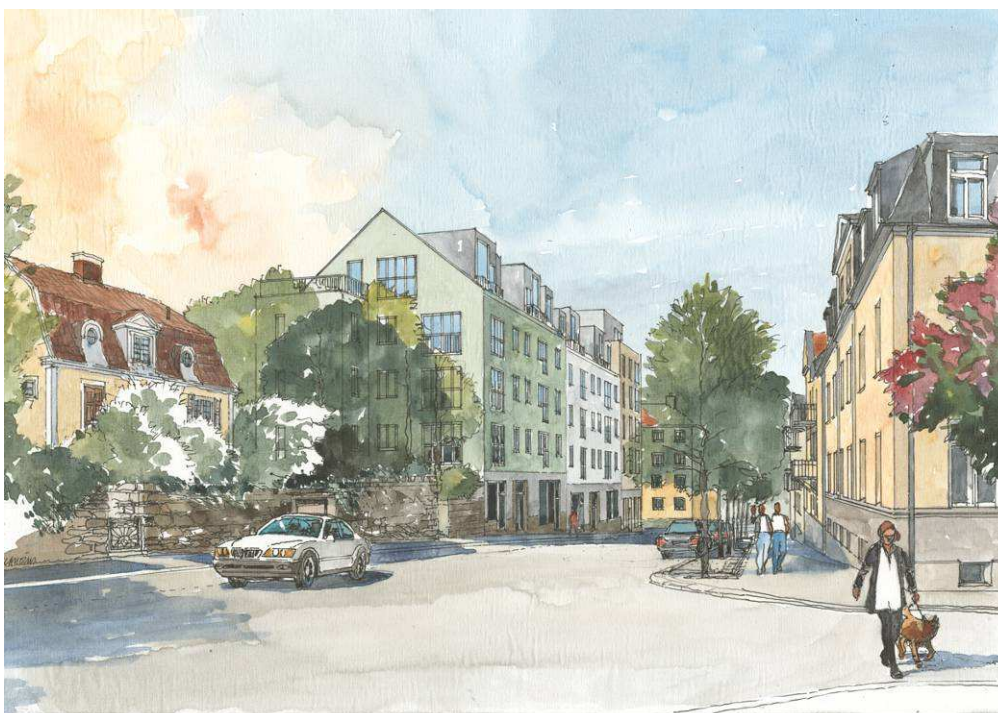
Gatuperspektiv Svandammsvägen (Illustration: Brunnberg & Forshed/Tema landskapsarkitekter).