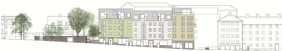
Fasadvy Svandammsvägen (Illustration: Brunnberg & Forshed/Tema landskapsarkitekter).

Fastigheten Martallen 34 planläggs enligt gällande plan och med skyddsbestämmelse att byggnadens exteriör inte får förvanskas. Byggrätt för ytterligare utbyggnad medges ej.