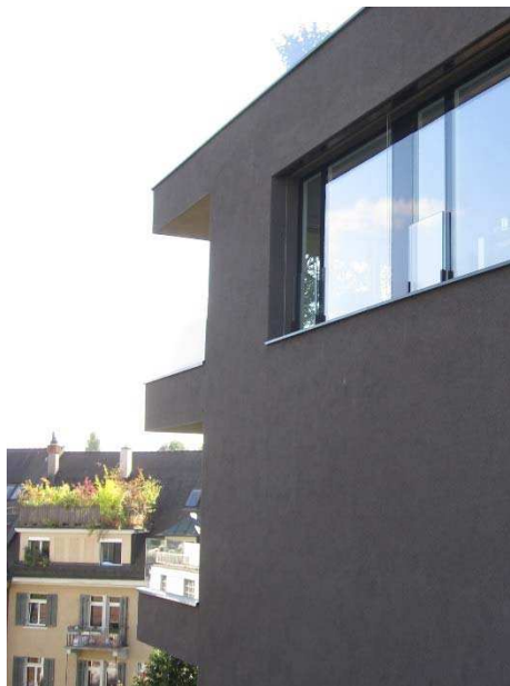
Referens på balkongfront lika fasad. Arkitekt: EM2N

Fasaden putsas i ljus kulör. Fönster har en mörkare kulör och är tydligt indragna i fasaden. Balkonger får en front lika takterrasser. Glasskärmar för skydd mot trafikbuller ligger bakom räcke utan vertikala profiler.